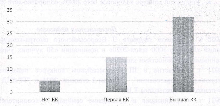
Диаграмма 3. Распределение педагогических работников по критерию «Квалификационная категория»